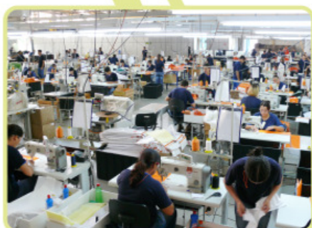
Setor de costura