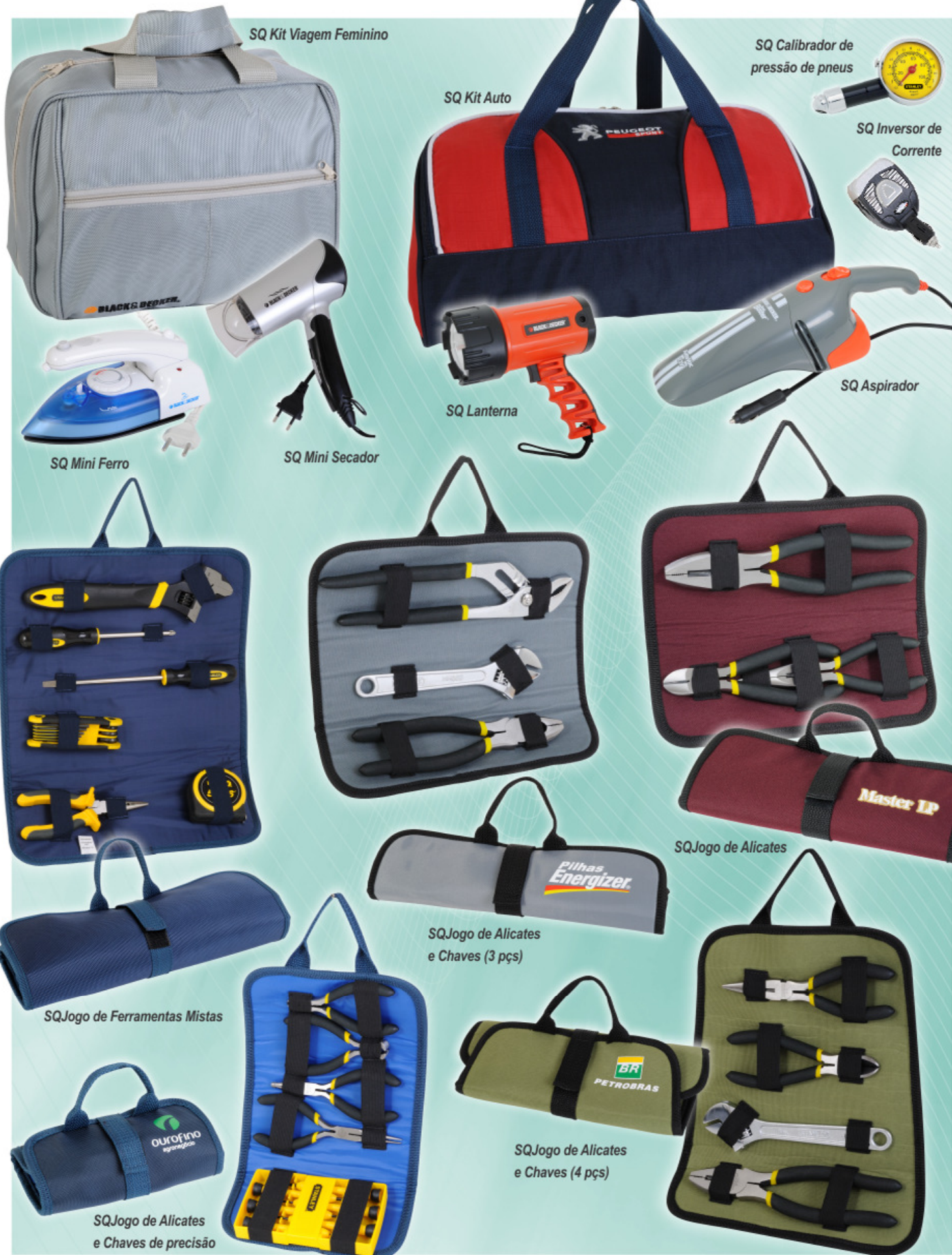
SQ Kit Viagem Feminino