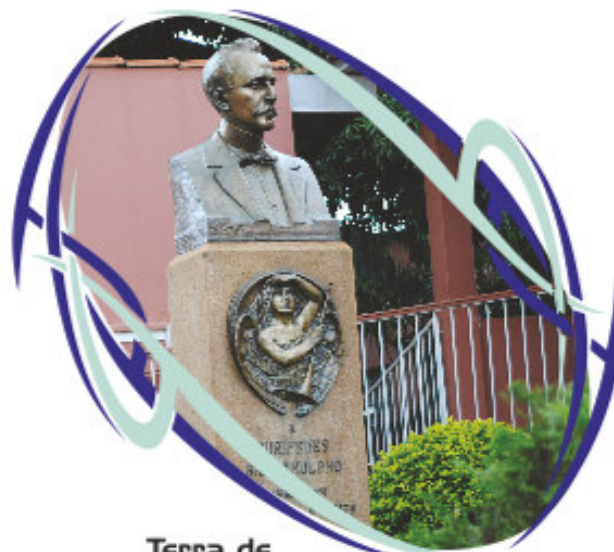
Terra de Eurípedes Barsanulfo

Distância de Sacramento às principais Capitais Brasileiras São Paulo - 500km Belo Horizonte - 451km Brasília - 571km Goiânia - 496 Rio de Janeiro - 813km Vitória - 969km