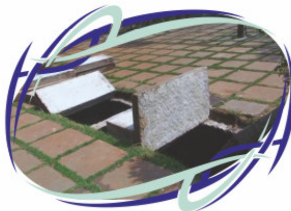
Tanques de decantação

A empresa comprometida com o fortalecimento das questões sócio ambientais, realiza projetos que asseguram a natureza e o meio ambiente. Essa é uma preocupação constante da Sak's pioneira nas ações promovidas ambientalmente, que serve como espelho para as indústrias quando o assunto é cuidar do meio em que se vive. Os membros do Projeto Heróis do Futuro também participam das campanhas ambientais sendo incentivados ao conceito da sustentabilidade e o respeito e valores das questões do meio ambiental.