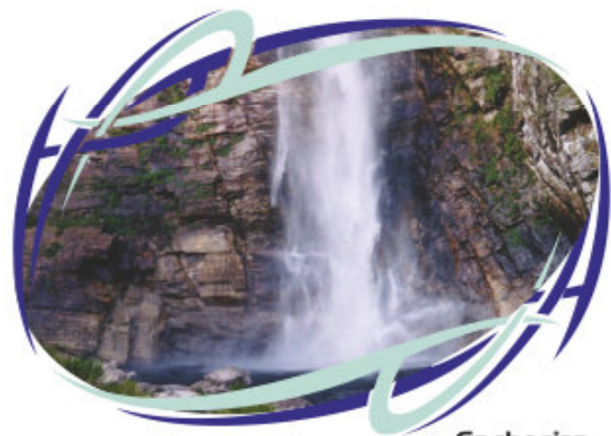
Cachoeira Casca Danta