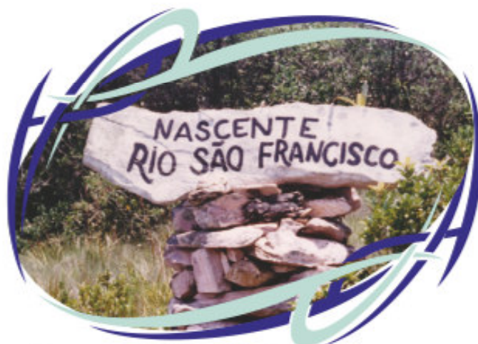
Nascente do Rio São Francisco no Parque Nacional da Serra da Canastra

Distância de Sacramento às principais Capitais Brasileiras São Paulo - 500km Belo Horizonte - 451km Brasília - 571km Goiânia - 496 Rio de Janeiro - 813km Vitória - 969km