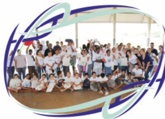
Entidade que recebe doações da Sak's - Lar Solidário

A valorização que a Equipe Sak's tem com o bem estar social compromete-se com o dever a ser cumprido perante a sociedade: as ações sociais promovidas pela empresa buscam o progresso e, como consequência, a evolução das pessoas no mercado profissional e na vida pessoal. Por exemplo, o Projeto Heróis do Futuro, idealizado e cumprido pela diretoria da empresa promove o bem estar e aprendizado de jovens filhos de funcionários da Sak's.