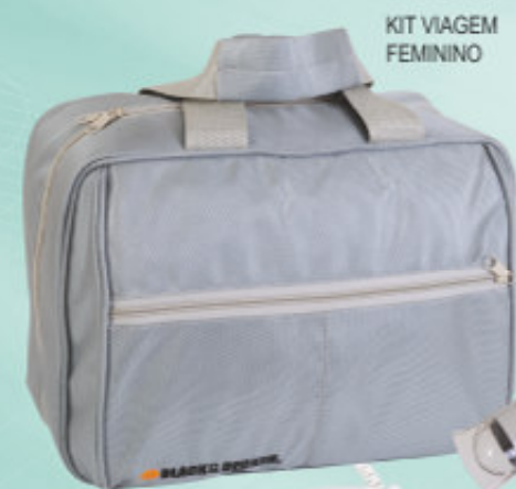
KIT VIAGEM FEMININO