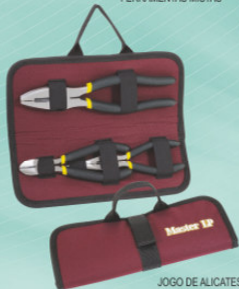
JOGO DE ALICATES