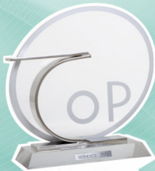
Prêmio Top Bríndice 2010 1º lugar