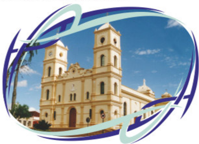
Igreja Nossa Sra. do Santíssimo Sacramento