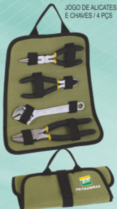
JOGO DE ALICATES E CHAVES / 4 PÇS