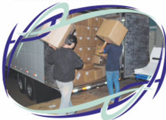
Doações da empresa para as vítimas da enchente no Rio de Janeiro em 2010