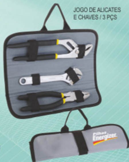
JOGO DE ALICATES E CHAVES / 3 PÇS