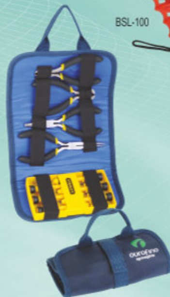
JOGO DE ALICATES E CHAVES DE PRECISÃO