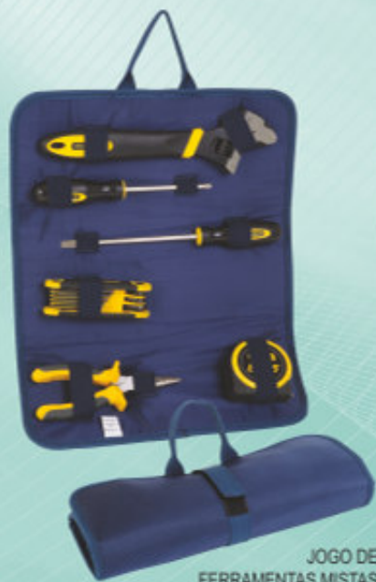
JOGO DE FERRAMENTAS MISTAS