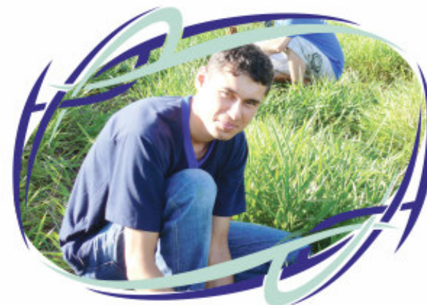
Manutenção em 2010 da área preservada

Preserva-se uma área na entrada de Sacramento na Rodovia MG-190, plantada por funcionários em 2008, com mais de 800 mudas de árvores. As condições desse plantio favorecem a preservação do meio ambiente.