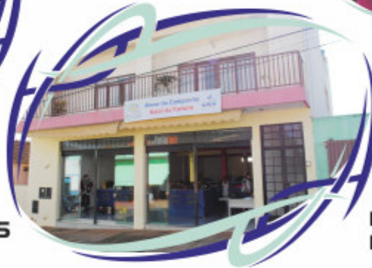
Bazar da Campanha Natal da Fartura 2010