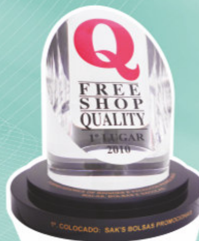
Prêmio Freeshop Quality 2010 1º lugar