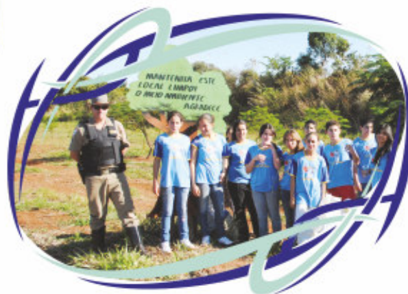
Adolescentes "Heróis do Futuro" na campanha da Semana Ambiental