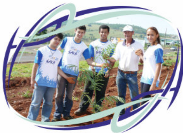
Funcionários no plantio em 2008